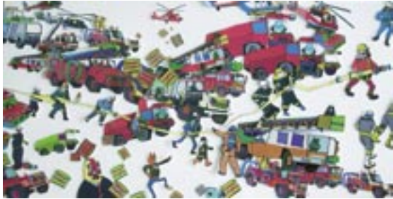
作家名：藤吉 匡 出展店舗：Kuu Kuu タイトル：EMERGENCY CANDLE (2002)