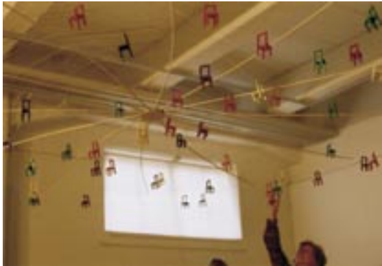
作家名：荒木 珠奈 出展店舗：Kuu Kuu タイトル：Evoke under a circle (2002)