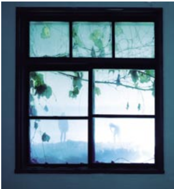
作家名：鷺山 啓輔 出展店舗：PEPACAFE FOREST タイトル：浮島 (2002)