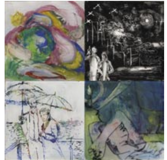
作家名：伊藤 妙恵 出展店舗：Days タイトル：Days (2003)