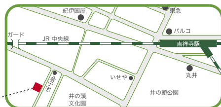
■「基地カフェ」 Toki Art Space / Annex