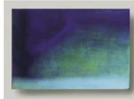
作家名：丹治 匠 出展店舗：西洋乞食 タイトル：部屋のかど (2002)