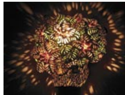
作家名：幸谷 慶太 出展店舗：foo-ang タイトル：サクラ (2002)