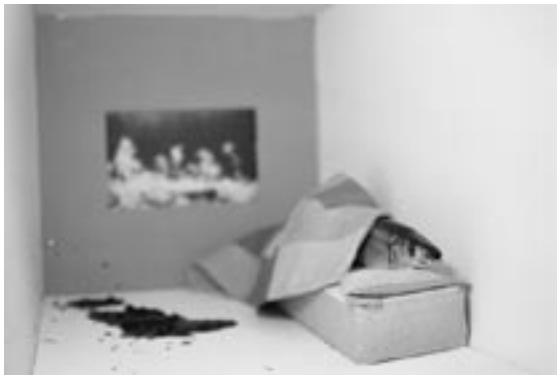
作家名：足立 桃子 出展店舗：蔵 タイトル：Bed #03 (2002)