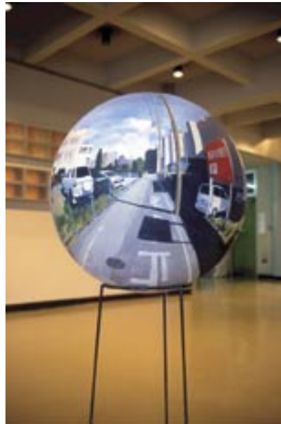
作家名：鮫島 大輔 出展店舗：A.B.Cafe タイトル：ビッグフラットボール (2001)