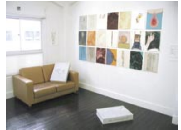
作家名：江口 暢彌 出展店舗：A.B.Cafe タイトル：BLUEORANGE (2002)