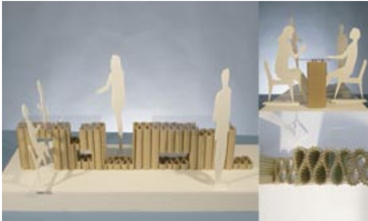
作家名：unit Y 出展店舗：A.B.Cafe タイトル：枯山水