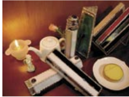
作家名：荒木 茂子 出展店舗：茶房 武蔵野文庫