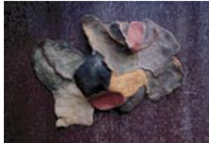
作家名：富沢 恭子 出展店舗：Kuu Kuu タイトル：時間 (2002)